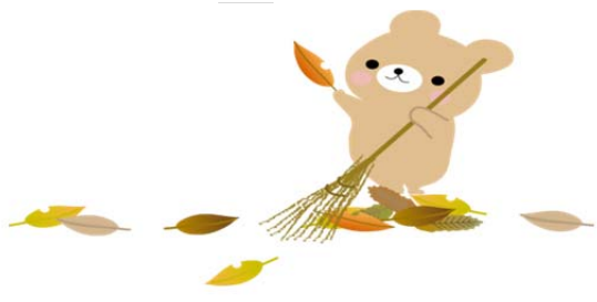
9月 全教一斉にをいがけデー 活動予定表

全教一斉にをいがけデー (九月二十八〜三十日) 詰所では、初日の二十八日に近鉄「結崎駅」までマ イクロバスで繰り出し、駅周辺での戸別訪問を行い、 翌日は「大和八木駅」頭にて二組に分かれての路傍 講演、そして最終日の三十日には「近鉄奈良駅」か